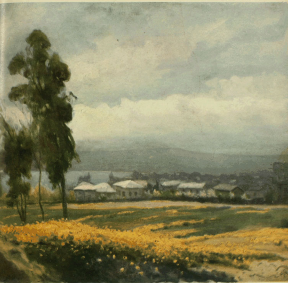
PAISAJE DE ALFREDO HELSBY