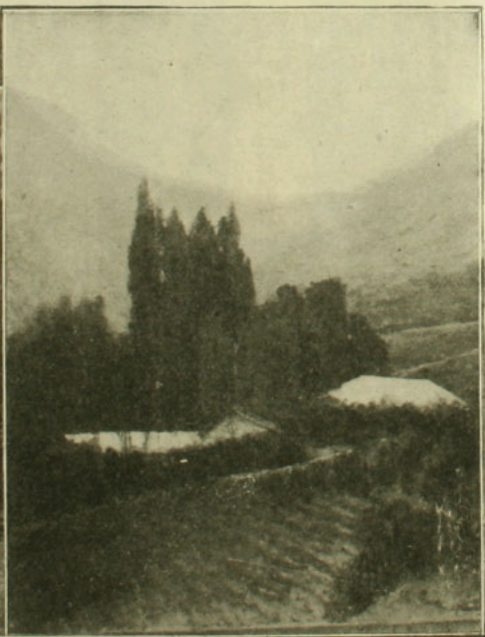
Dos hermosos paisajes de Helsby.