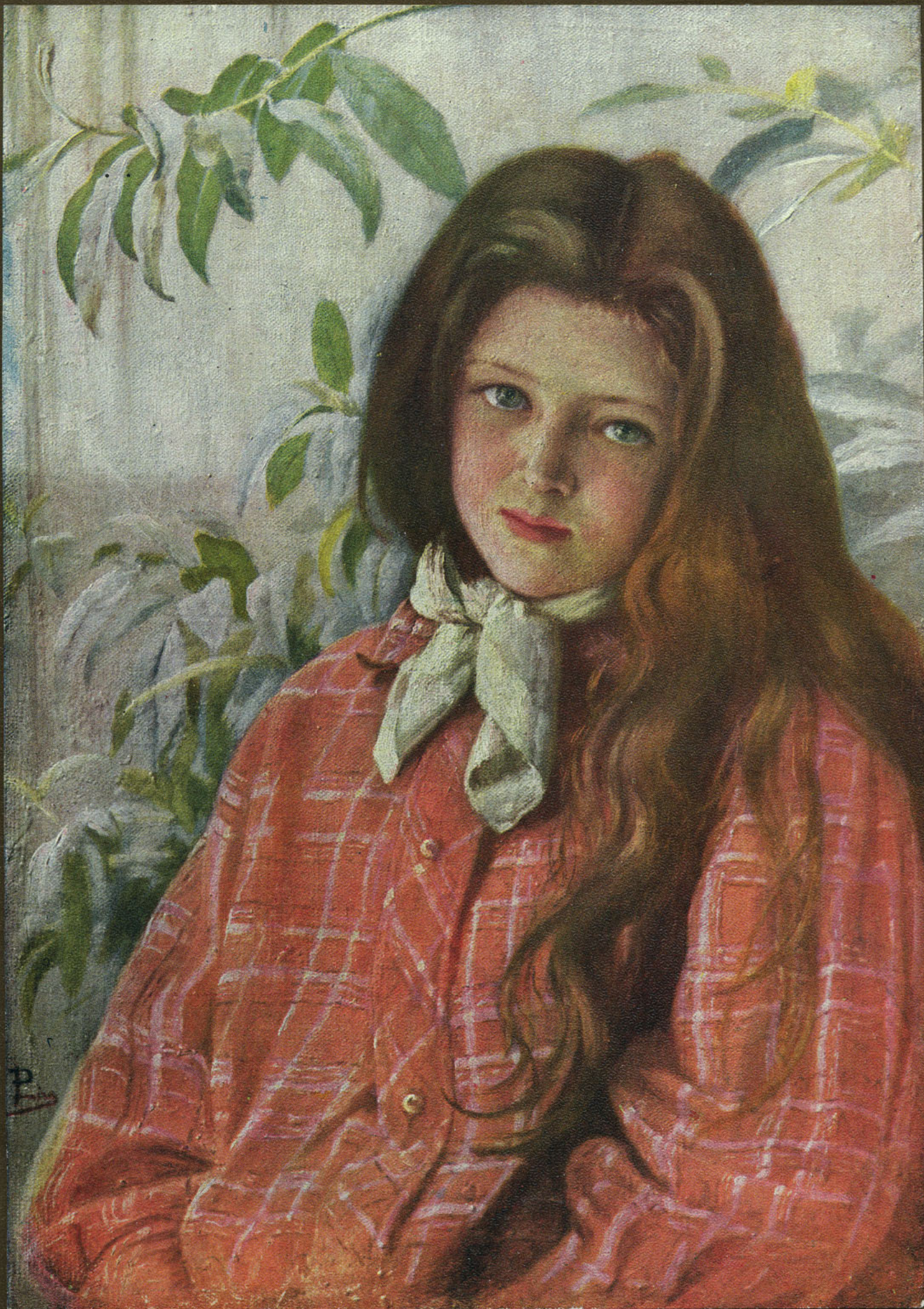
FLOR SILVESTRE.—Cuadro de Don Pedro Lira