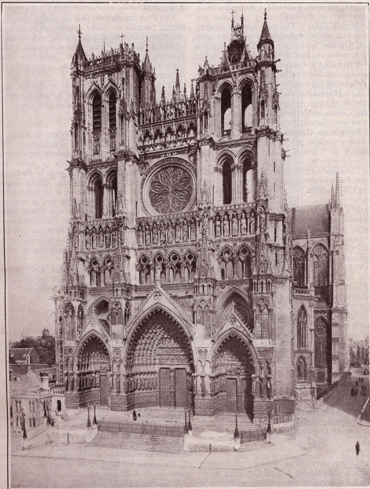
CATEDRAL DE AMIENS