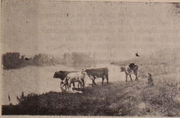
Cuadro de RAFAEL CORREA

A las líneas anteriores, escritas con motivo de nuestro Salon de 1900, agregaremos que el señor Correa ha seguido en Europa estudiando con empeñosa intelijencia, i que en estos dos últimos años ha ensanchado i profundizado sus conocimientos de una manera visible. Su nombre i sus obras van abriéndose paso de dia en dia, de tal suerte que, segun nuestras informaciones, ya puede vivir en París holgadamente con la venta de sus producciones artísticas.