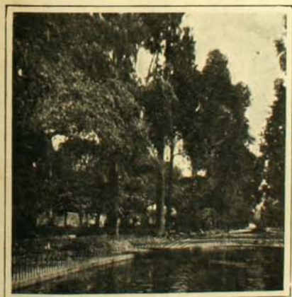
Laguna del Parque "El Prado"