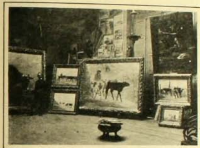
Otra de las secciones

Por su parte ZIG-ZAG se hace un deber desear al distinguido pintor un viaje provechoso en todo sentido.