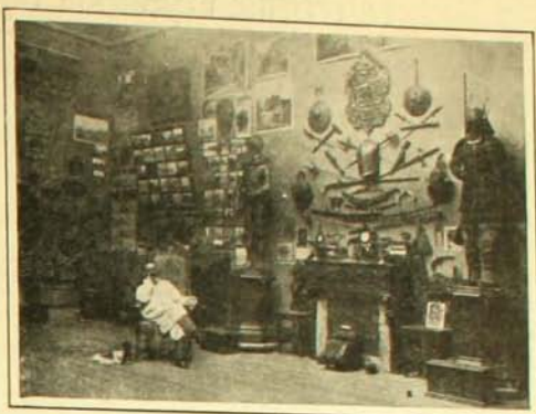
Un rincón del taller del señor Correa

Aprovechará esta ocasión el señor Correa, para llevar un conjunto de doce cuadros, pintados por