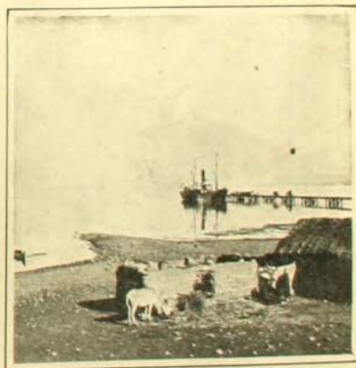
Puerto Perez del lago Titicaca