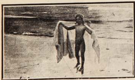
Saliendo del baño.