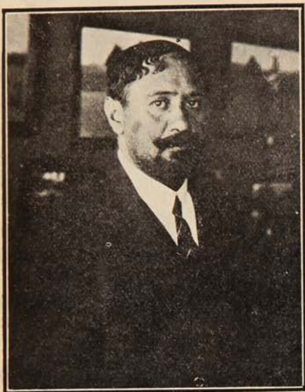
D. Benito Rebolledo Correa, notable pintor que expone sus cuadros en Valparaíso, Prat, 122.

Ayer se ha inaugurado en Valparaíso, calle Arturo Prat, N.º 122, una exposición de cuadros del maestro D. Benito Rebolledo Correa, uno de los mejores pintores de Chile, y reputado como honra de la pintura sud-americana.