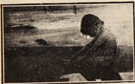
Antes del baño.